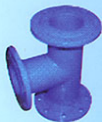
Te en fonte à bride