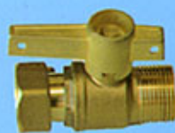
Robinet d'arrêt Antifraude