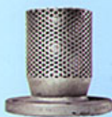
Crépine en acier galvanisé