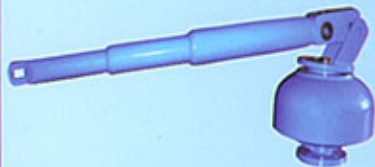
Obturbateur à disque