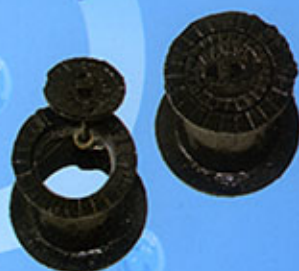
Bouche à clé