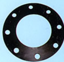
Brides plates à souder