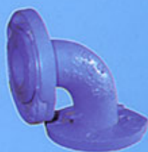
Coude en fonte ductile