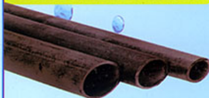
Tubes sans soudure