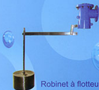
Robinet à flotteur