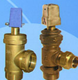
Robinet de prise charge