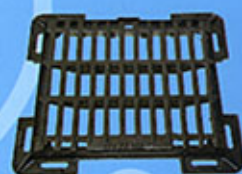
Grille Plate font ductile