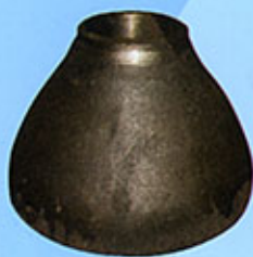
Cône de réduction