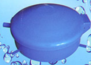
Capot de regard bombe en acier peinturé