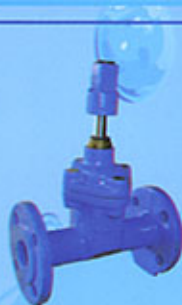
Vanne à opercule caoutchouc