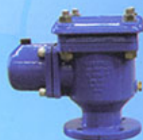
Ventouse triple fonction