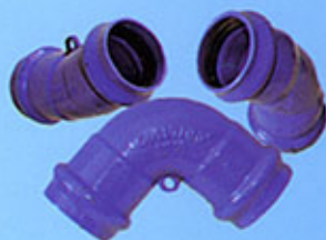
Coude à emboîtements