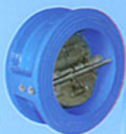
Clapet à double battant