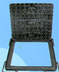
Regard Carré font ductile