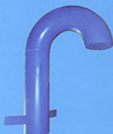
Col de cygne