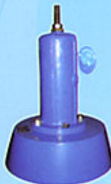
Soupape de décharge