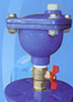
Ventouse simple fonction