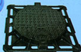
regard font ductile C 250