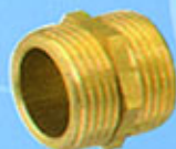
raccord en laiton