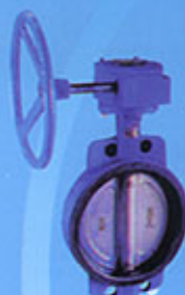
Vanne à papillon