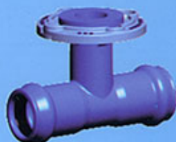
Té à emboîtement