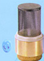
Crépine en cuivre