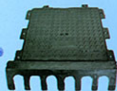
Avaloir font ductile