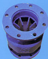
Stabilisateur d'Ecoulement S3D