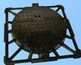
Regard font ductile D.400