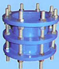
Joint de démontage