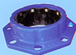
Raccord bride major