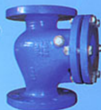
Clapet à battant