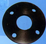
Joint pour Brides plates