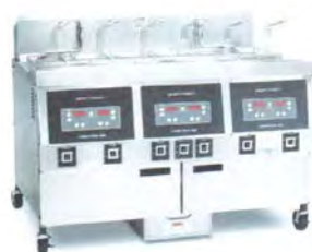
Friteuse ouverte électrique OFE-321 / OFE-322 / OFE-323