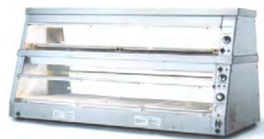
Vitrine de maintien en température