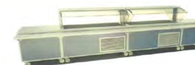
Self service mobile