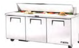
Table de préparation sandwichs / salades à portes et tiroirs