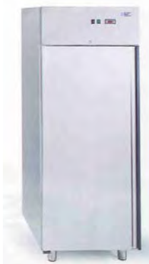
Armoire de laboratoire a température positive -2/+8°C ou négative -18/ -15°C

2 portes inox 1 porte et 2 portillons inox 4 portillons inox