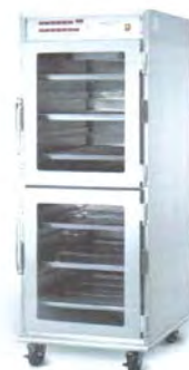
Armoire de maintien en température