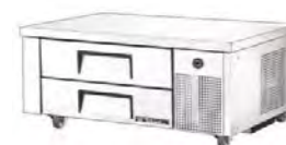
Soubassement réfrigérés avec 2 ou 4 tiroirs