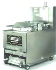
Friteuse à pression électrique PXE 100