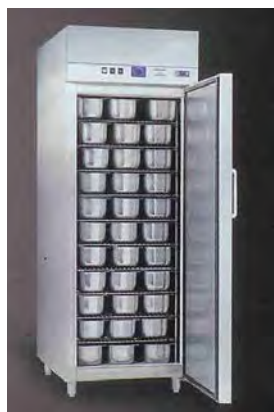
Armoire de laboratoire inox ou prélaqué pour la conservation de crème glacée température - 18°C