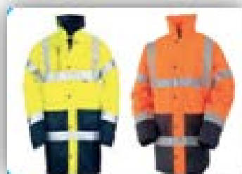
Parka haute visibilité