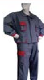
Jacket et Pantalon