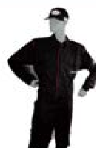
Ensemble agent de sécurité