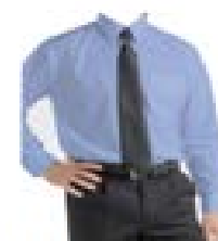
Chemise - Cravate