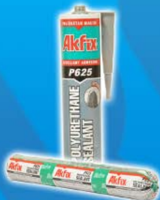
Mastique polyurethane P625