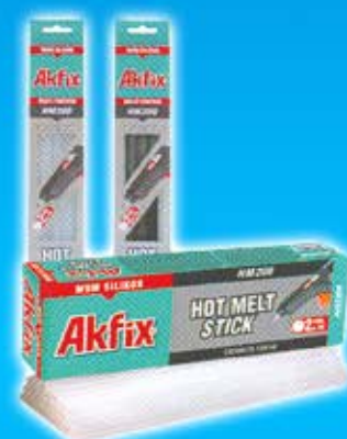
Colle Thermique HM208