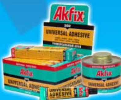
Colle universelle 202 R