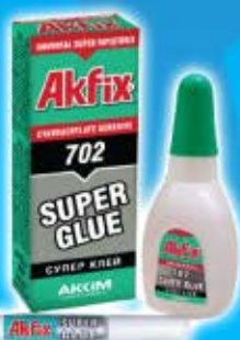
Super colle REF 702