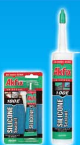
Silicone Acetique 100E