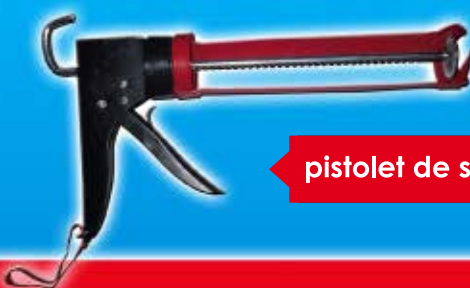
pistolet de silicone