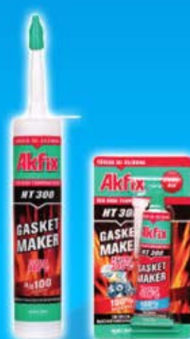
Silicone Haute Temperature Ref HT300