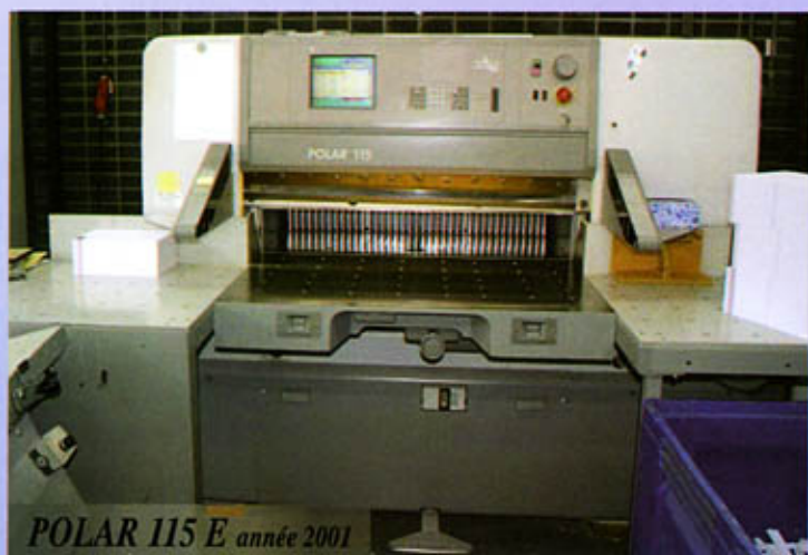
POLAR 115 E année 2001