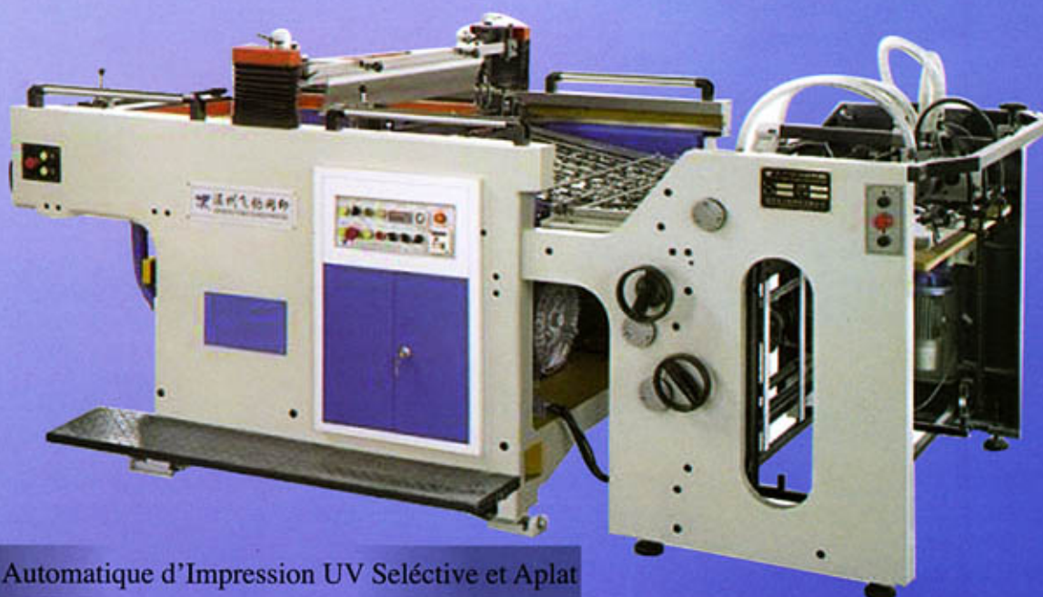
Machine Automatique d'Impression UV Sélective et Aplat