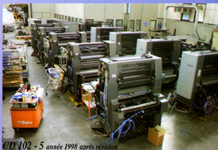
CD 102 - 5 année 1998 après révision