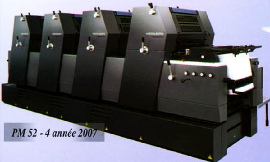
PM 52 - 4 année 2007