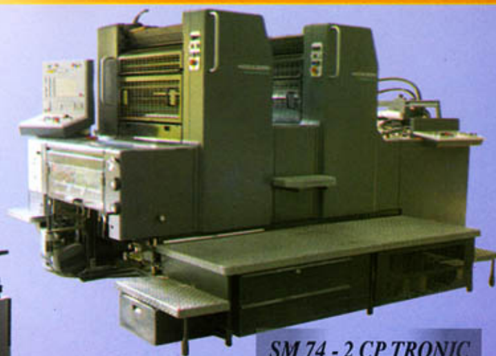
SM 74 - 2 CP TRONIC année 2000