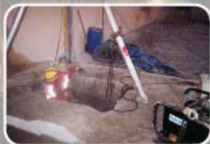
Fermeture de puits de mines