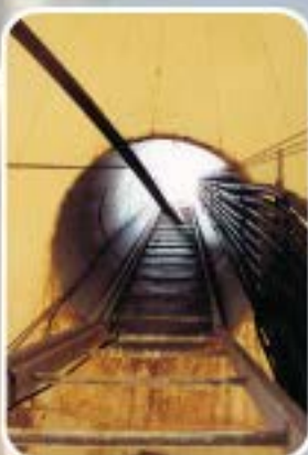
Interventions de maintenance