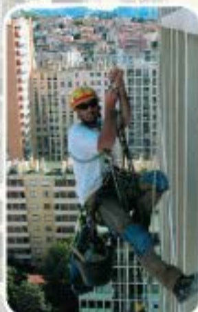
Purge et reprise de maçonneries