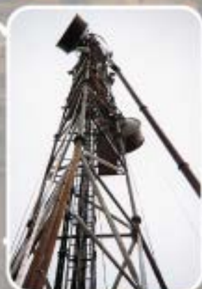
Maintenance en télécommunication