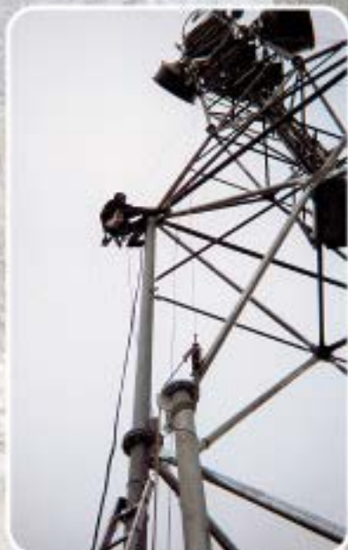
Sécurisation de sites