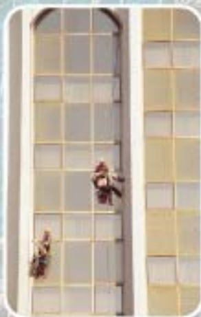
Peinture de façades