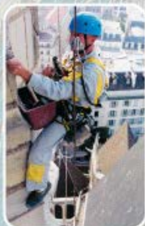
Purge de monuments historiques