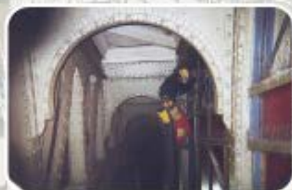
Nettoyage et pose de pics anti-pigeons