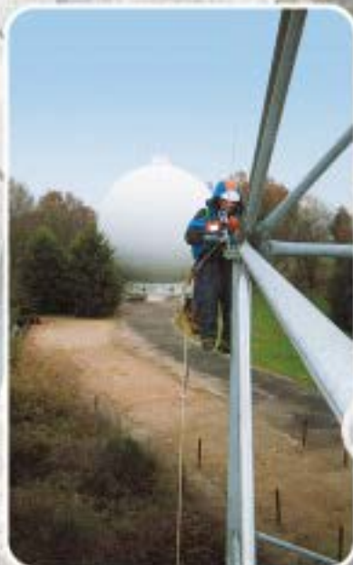
Inspection de sites Industriel