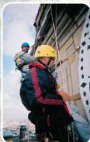
Contrôle de façade de monuments historiques