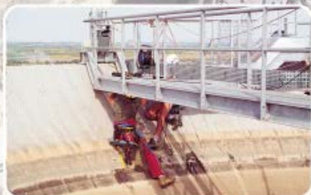
Installation de passerelles sécurisées