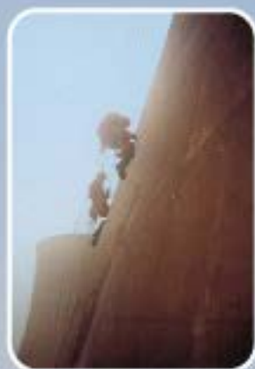
Intervention sur refroidisseur de centrale nucléaire