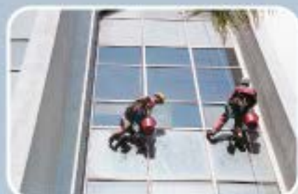
Nettoyage de surfaces vitrées