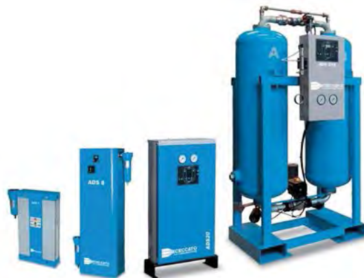
Sécheurs par adsorption