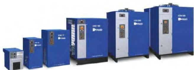
Sécheurs par réfrigération

Choisissez la technologie à air comprimé qui correspond le mieux à vos besoins. Chez Power Air , nous proposons des compresseurs à pistons et des compresseurs à vis. Nous disposons également d'autres technologies à air comprimé. Pour en savoir plus, contactez votre Centre Clients local (détails disponibles sous contacts).