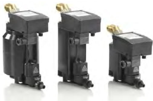
Purge des condensats