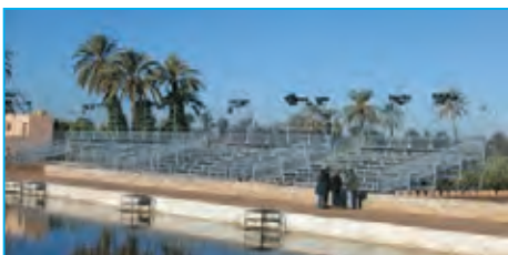
Tribunes Layher - Marrakech