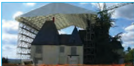
Protection Couvralu Layher