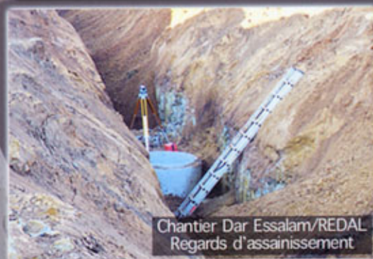
Chantier Dar Essalam/REDAL Regards d'assainissement