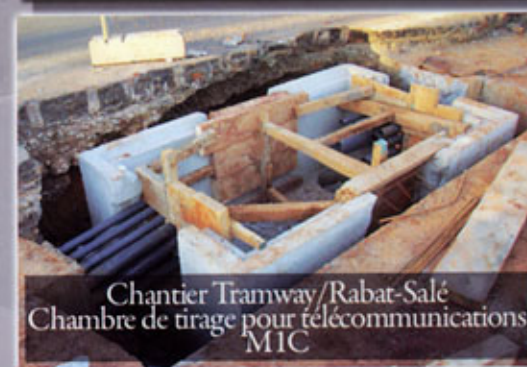
Chantier Tramway/Rabat-Salé Chambre de tirage pour télécommunications MIC