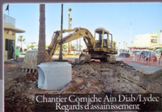
Chantier Corniche Ain Diab/Lydec Regards d'assainissement