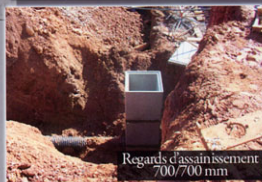
Regards d'assainissement 700/700 mm