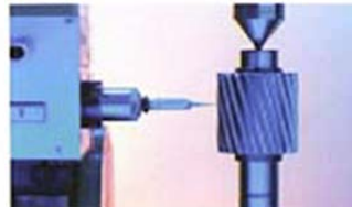
Contrôle denture Maag PH 60