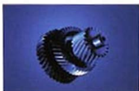
Pignon droit et Hélicoïdaux