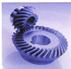
Couples spiraux coniques