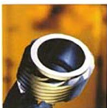
Vis sans fin